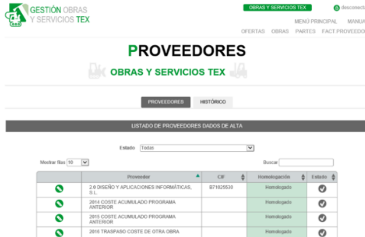
Imagen: Programa de control de costes/proveedores Obras y Servicios Tex.

Para la elección de proveedor, puede ser que se necesite contactar con nuevos proveedores o que se utilice el Programa de Costes para ver el listado de proveedores homologados.